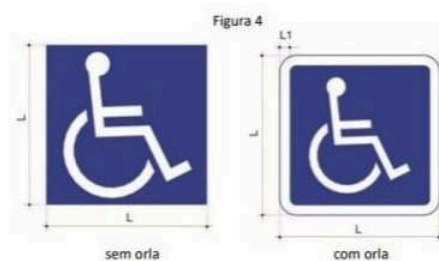
Quadro 1 – Características do Símbolo Internacional de Acesso (SIA)